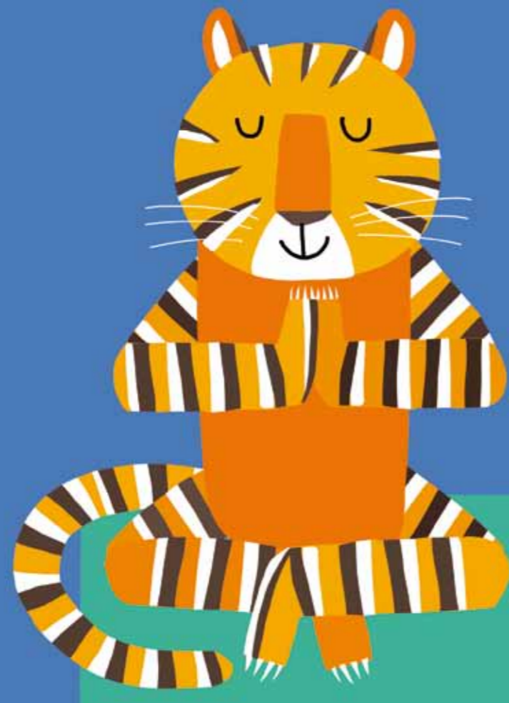
Illustrazione di Giulia Orecchia